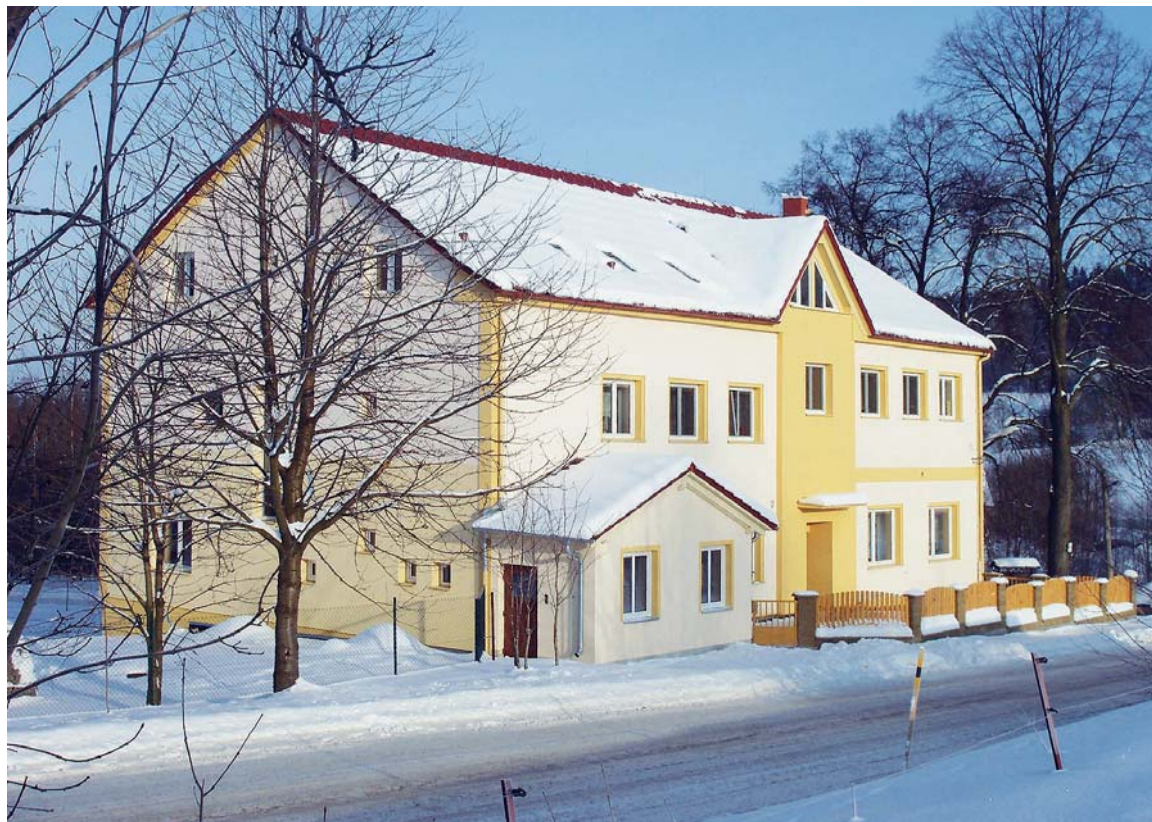
Azylový dům pro těhotné ženy v tísní v Hamrech.