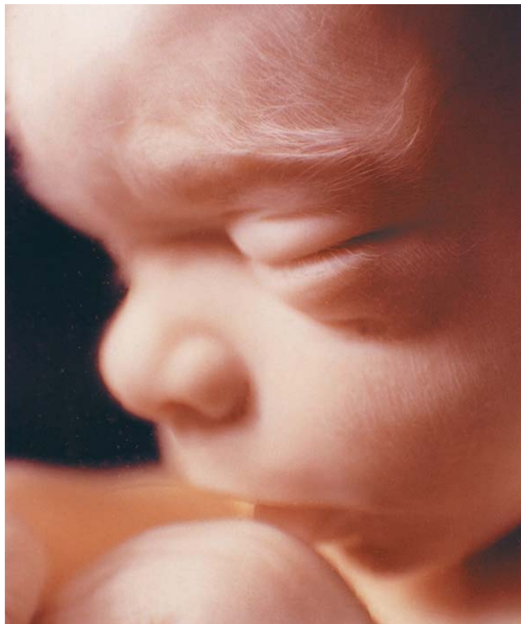
Dítě v pátém měsíci od početí.

Ten týden jsem skoro nespala. Už se to nedalo vydržet a tož, že se v nedělu svěřím paterovi ve zpovědi. On nás dobře znal, tož snad pochopí, poradí. Nedovedeš si představit, jak mi bylo. Nohy se klepaly, brada třepala. Tož vejdou dovnitř: „Pochválen buď Pán Ježíš Kristus.“ Leze to ze mě jak z chlupaté deky, ani pořádně nevím, co mu vlastně chci povědět. Pak to nějak ze mě vypadlo, že jsem v požehnaném stavu a čekáme šesté. A už jsem měla na jazyku i to další, co s tím chci udělat. Ale