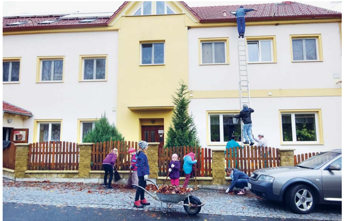
Dobrovolnická brigáda v azylovém domě.

Později, již v pokročilejším věku, se nám narodili další dva kluci, přičemž u nejmladšího byl diagnostikován dětský autismus. A svět se nám (hlavně mně) převrátil naruby. Rázem se nám jeví