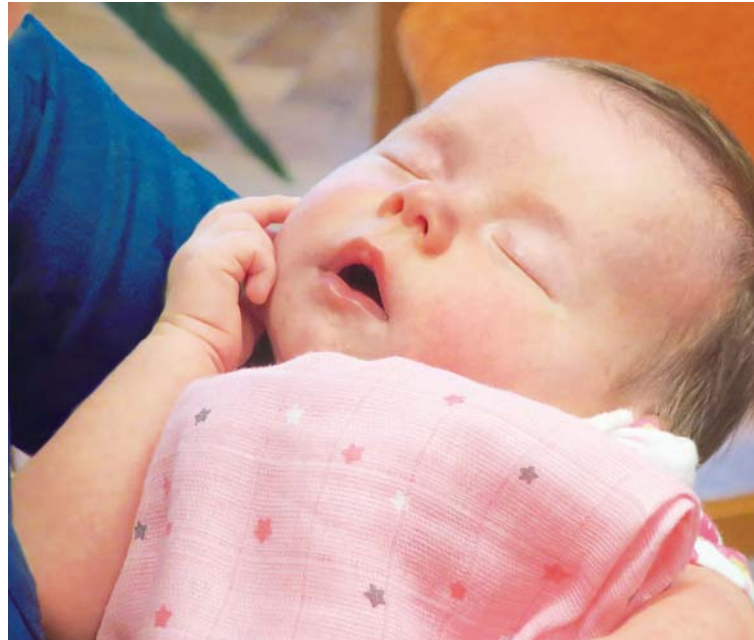
Vytvářejte s námi betlém dětem.

I ta děcka, která prošla tímto světem, aniž se stihla narodit, a nepřijata rodiči, se vrátila domů k Otci. Také jsou to jeho děti, naši bratři a sestry. K věčnému životu je zachránil Pán Ježíš stejně jako nás. A tak je asi moudré učit se – i se svými zraněními – pomáhat nosit kříže za někoho jiného, za ta nenarozená děcka. Po-