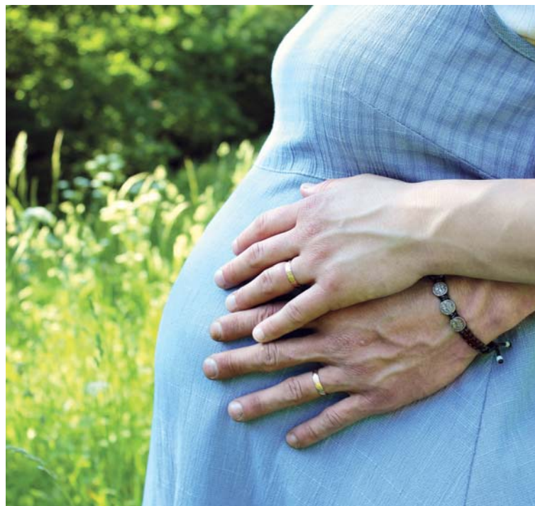
Stala jsem se součástí tak velkolepé skutečnosti! Ale vedle úžasu přichází spousta obav.

Bojím se o jeho zdraví? Mohu se sama učit žít zdravě. To přeče vím, jak se