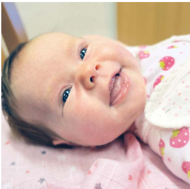
Kdo zná tajemství, jak se vzájemně ovlivňujeme?

Pro „naše mamky“ – klientky v azylovém domě – nesvedeme zázraky, zázraky dělá Bůh. Můžeme nabízet pomocnou ruku, ale to hlavní, zázračné, to, co mění život, je skryto v často neviditelných modlitbách, obětech, žehnáních. Pán Ježíš se na naší zemi „realizoval“ tím, že každého – jako dobré zrníčko – zaléval svým zájmem a dobrem. Marnotratně. Bez hranic. Našel smysl v tom, dělat „pomyslení“ Nebeskému Otci. Nedělal to jen kvůli těm, které osobně potkal, dělal to i pro „budoucí generace“ všech dob.