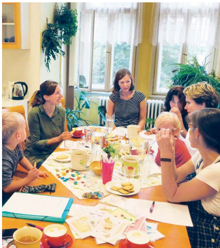
Setkání v poradně Cesta těhotenství.

Jsme tu pro všechny těhotné i pro ty, kdo se chtějí o těhotenství dozvědět více. Poradna vytváří prostor pro naslouchání, kde klientky mohou sdílet své obavy i hledání. Nabízíme jim setkání s doulou (asistentkou, která ženě poskytuje psychickou podporu – pozn. red.), v případě potřeby předáváme klientkám kontakty na další organizace a odborníky.