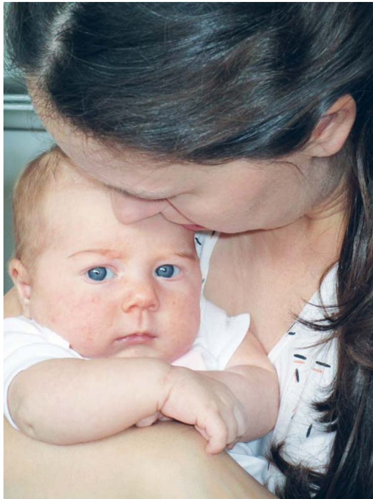
Proto tu jsme – pomoci dětem od početí najít bezpečné zázemí v mámině náručí.

V azylovém domě pro těhotné ženy v tísní jde o spolupráci ve službě