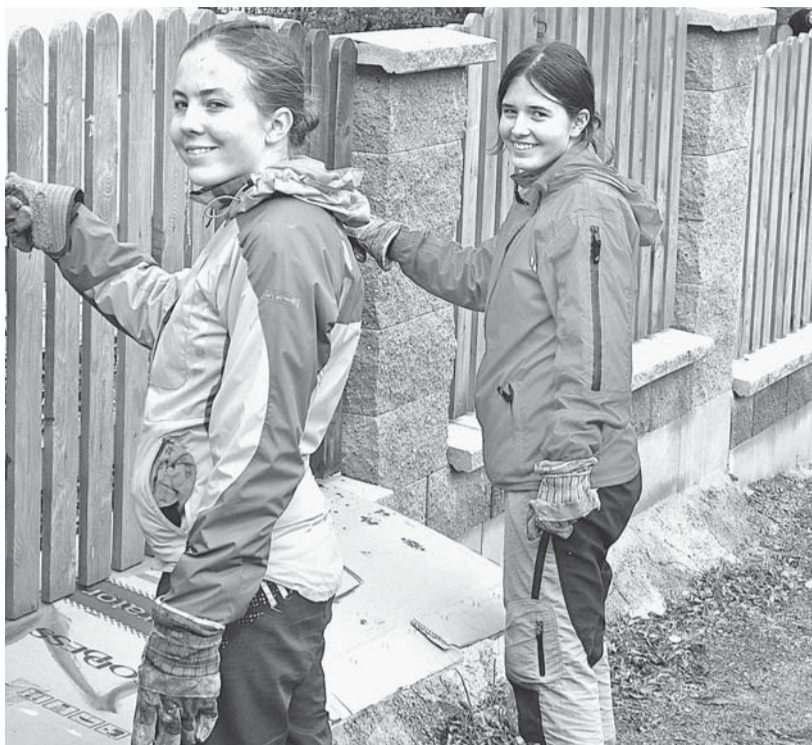
Dobrovolníci pomáhají zkrášlovat azylový dům zevnitř i zvenčí.

Tato otázka mě napadla jednoho časného rána, kdy jsme se s početnou rodinou vypravovali na pravidelnou brigádu do Azylového domu pro těhotné ženy v tísní. Odpo-