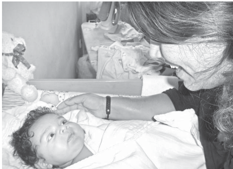
Když přichází na svět, cítí se jeho máma s doulou bezpečněji.

Na porodním sále jsem díky dule zažila atmosféru bezpečí a jistoty, která připomínala více domov než nemocnici. Byla tam pro mě a mé ještě nenarozené dítě. Povzbuzovala mě, dodávala mi odvalu, těšila, vy-